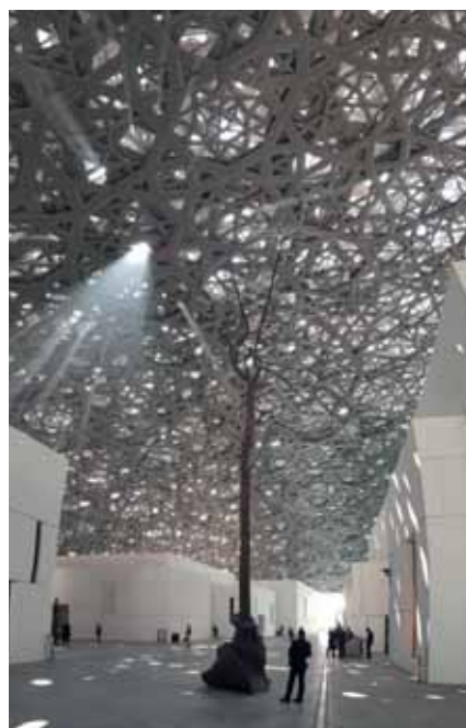
Erst kürzlich eröffnet: der Louvre Abu Dhabi

Das absolute Highlight ist aber zweifelsfrei die große Plattform unterhalb der Kuppel. Die verschieden angeordneten