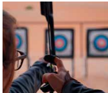
Bogenschießen war Teil der Desert-Challenge.

Der letzte Punkt auf der Aktivitäten-Liste gestaltete sich dann etwas beschaulicher – zumindest ab dem Punkt, an dem das Kamel endlich stand. Denn das Aufstehen dieses Tieres, während man auf seinem Rücken sitzt, ist etwas gewöhnungsbedürftig. Doch dann ist es ein befremdliches, aber gleichzeitig besonderes und gemütliches Gefühl. Auf dem Rücken eines Kamels ab durch die Wüste. Nach diesem kleinen „Ausritt“ ging es dann für uns schon wieder weiter. Wir mussten uns von den Weiten der Rub-al-khali verab-