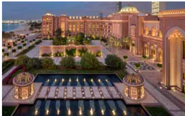
100 ha Grundstück, 302 Zimmer und 92 Suiten: das Emirates Palace.

Key Account Manager Corporate & MICE Rotana