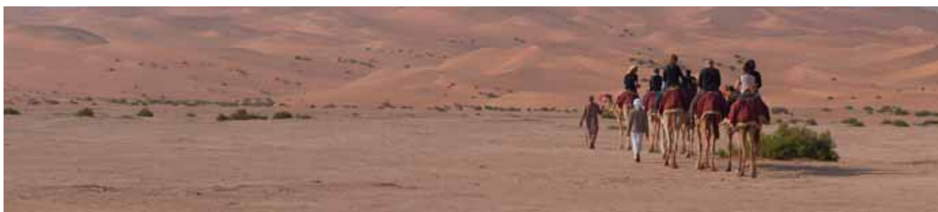
Auf dem Rücken eines Kamels kann man sich recht komfortabel durch die größte durchgehende Sandwüste der Welt bewegen.

schieden und machten uns auf den Weg in Richtung Abu Dhabi Stadt. Mit Verlassen des Deserts stand aber auch der Gewinner der Trophy fest: Glückwunsch an Singapur!