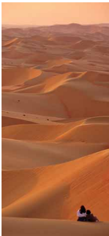
Endlose Weiten in der Rubh-al-khali.

in den verschiedensten Nuancen weißer oder roter Töne einfärben; das Farbspektrum ist beeindruckend. Aber auch die bis zu 300 Meter hohen Dünen, teilweise sehr steil wieder abfallend, verfehlen ihre Wirkung nicht.