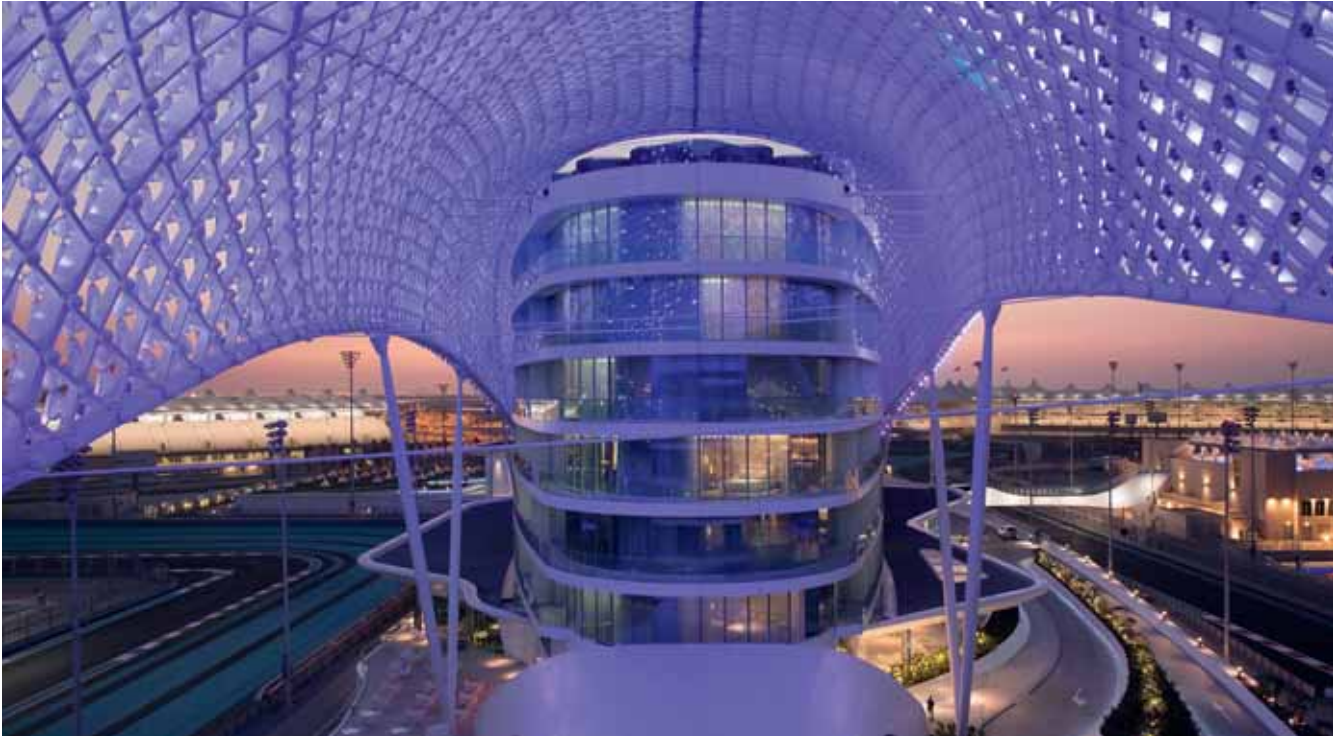
Planer freuen sich im Yas Viceroy über fast 500 Zimmer und vielfältige Eventspaces für bis zu 2.000 Personen, direkt am Yas Marina Circuit.