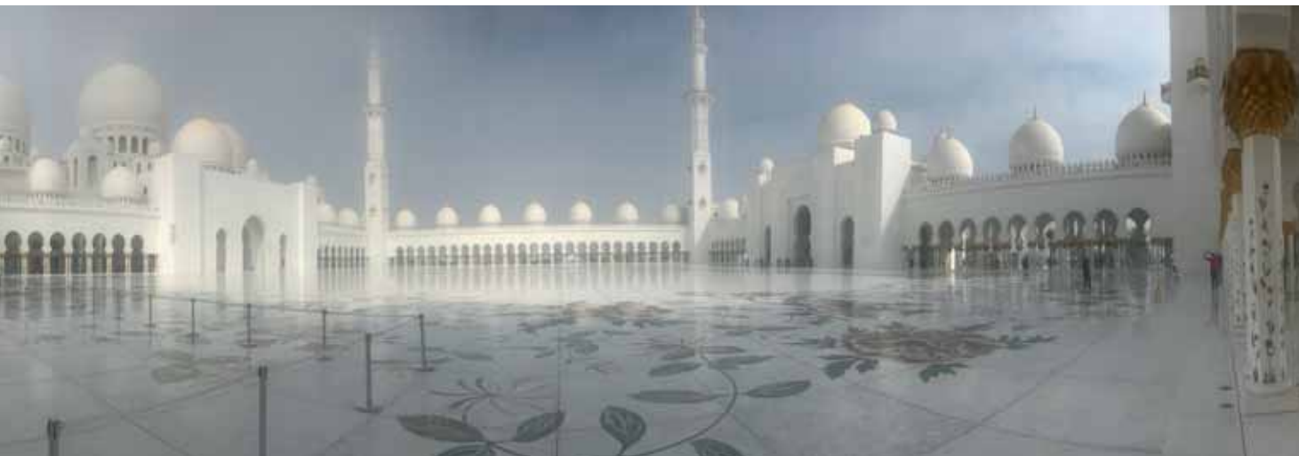
Definitiv einen Besuch wert: Die Sheikh-Zayed-Moschee ist die größte Moschee in den VAE und beeindruckt mit ihrer Architektur und Atmosphäre.

Verstrebungen des Daches ermöglichen ein Durchscheinen der Sonnenstrahlen. Ähnlich wie unter einem Palmendach entsteht auf diese Weise der sogenannte „Rain of light“, den wir bereits in der Al-Ain-