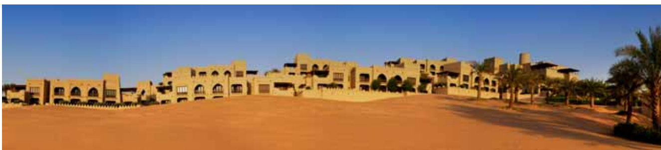
Das Wüstenresort Qasr al Sarab liegt mitten in der Rubh-al-khali und bietet aufgrund seiner Dimension zahlreiche Möglichkeiten auf höchstem Niveau.

ßen zurückgelegt wurde, galt es etwa eine Stunde vor der Ankunft am Ziel: aussteigen und Luft aus den Reifen lassen. Nur so lässt sich auf dem weichen Wüstensand der Rub-al-khali vorankommen. Nachdem die Jeeps, mit mehr oder weniger Hilfe durch die mitreisenden Guides, den richtigen Luftdruck erreicht und sich alle wieder in ihre Fahrzeuge gesetzt hatten, begann die Desert-Experience auf dem Weg zum Qasr Al Sarab Resort by Anantara. Doch bevor wir im Wüstenresort eincheckten, durften wir erst einmal die farbliche Vielfalt der größten durchgängigen Sandwüste der Welt erleben. Seien es Eisen- oder aber Salzablagerungen, die den Sand entweder