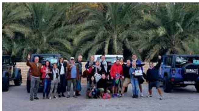
Self-Drive-Experience, Wüste, Oase und arabische Kultur: Die zweite MICE-Trophy, diesmal #InAbuDhabi, begeisterte alle Teilnehmer.

Die erste „Herberge“ für uns war das Al Ain Rotana. Das Fünfsternen-Haus liegt im Zentrum Al Ains und bietet daher die Möglichkeit einer sehr guten Kombination von historischem Rahmenprogramm und Konferenzmöglichkeiten. Großzügig angelegt finden Planer hier 242 Zimmer, Suiten und Chalets, die schon in der kleinsten Kategorie mit ordentlichen 37 qm punkten. Der Konferenzbereich erstreckt sich über einen eigenen Gebäudeteil und kann insofern vollständig unabhängig vom Hotelbetrieb bespielt werden. Durch die entsprechende Verbindung beziehungsweise Trennung der Räume finden Veranstaltungen zwischen 25 und 1.200 Personen den passenden Rahmen. Ähnlich flexibel gestalten sich die kulinarischen Möglichkeiten im Al Ain Rotana: Gleich sechs Restaurants verteilen sich auf das Areal. Wir nahmen sowohl zum Lunch als auch zum Dinner im international ausgerichteten „Zest“ Platz und mussten uns zwischen Hummus, Fatoush, Tabouleh und anderen Spezialitäten entscheiden.