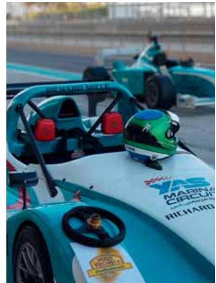
High-Speed und Adrenalin auf dem Yas Marina Circuit. In Abu Dhabi nicht nur für Rennfahrer möglich.

erfuhren wir, worauf zu achten ist und wie sich die Fahrt gestalten würde. Mit jedem Sheet der Präsentation, die uns die Strecke näherbrachte, stieg der Adrenalin-Pegel im Raum spürbar. Als es dann wieder hin-