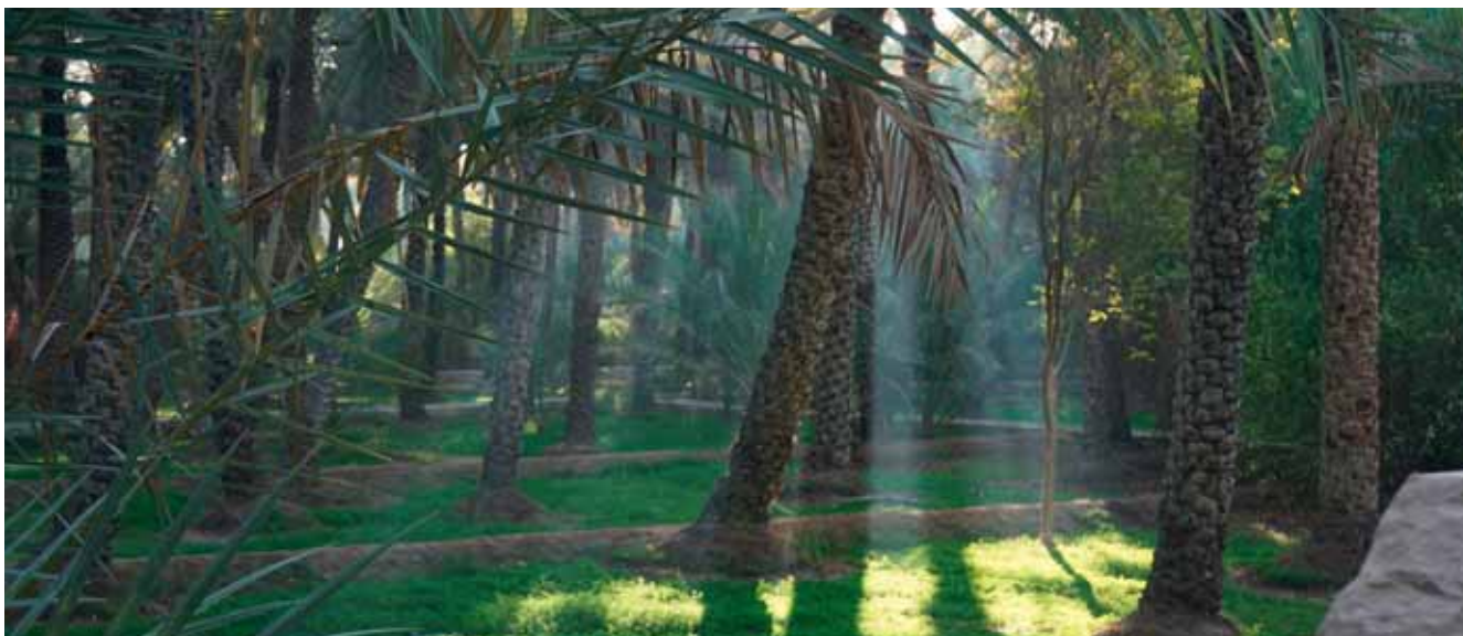
Die Al-Ain-Oase mit ihrem 3.000 Jahre alten Bewässerungssystem ist Teil des UNESCO-Weltkulturerbes.

Nach dem Zwischenstopp in der Al-Ain-Oase hieß es wieder aufsitzen. Die längste Distanz der Trophy stand uns bevor. Zwischen Al Ain und dem Herzen des sogenannten „Empty Quarter“ liegen über 300 km Wegstrecke. Während der erste Teil der Strecke noch über befestigte Stra-