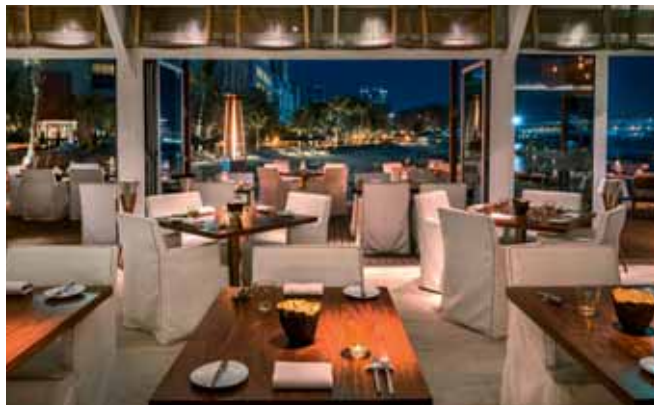
Das Beach Rotana ist das Flaggschiff der arabischen Hotelkette Rotana.

verschiedenster Art. Nicht zu vergessen, der hauseigene Hotelstrand, den wir ja bereits am Abend zuvor erfolgreich auf seine Eventtauglichkeit getestet hatten.