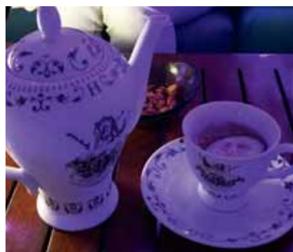
Santander High Tea: der Cocktail aus der Teekanne

Ob Restaurant oder Lounge, das Viceroy eröffnet Gästen in kulinarischer Hinsicht einen äußerst abwechslungsreichen Aufenthalt mit insgesamt elf Möglichkeiten, darunter beispielsweise ein italienisches, ein japanisches und ein indisches Restaurant. Da kann die Auswahl hin und wieder schwerfallen. Was allerdings in jedem Fall auf der To-do-Liste stehen sollte, ist die